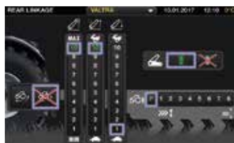
9-tums pekskärmen, stora kontroller, inställningar och funktioner är lätta att förstå.