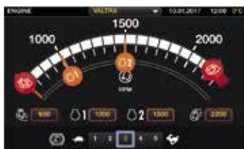
Logisk uppsättning av inställningar med svepgester. Alla inställningar lagras automatiskt i minnet.