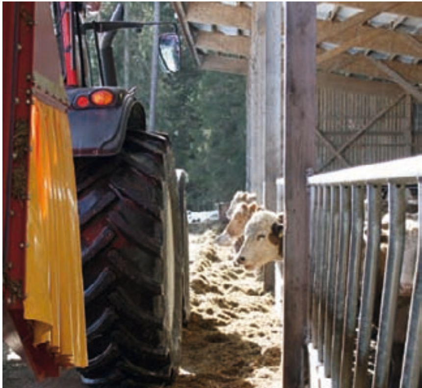
På en gård med över 400 köttjur blir det många timmar i traktorn varje år. Då är det viktigt att tänka på både ergonomi och komfort.

Valtra är också kända för att hålla ett bra andrahandsvärde, något som företags-