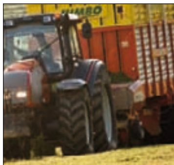
Allt närmare samarbete mellan traktor och maskin Sidan 16