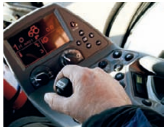
Det sköna och praktiska armstödet erbjuder både komfort och körglädje!