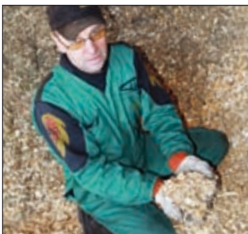
Träenergi ger jordbrukarna besparingar och entreprenörer tilläggsinkomster Sidan 9