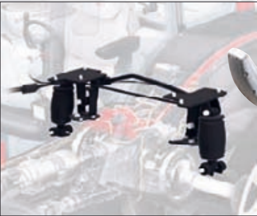
Semiaktiv AutoComfort-hyttfjädring är något helt unikt i traktorvärlden. Den belönades med Innovationsmedalj i silver på Agritechnica-mässan.