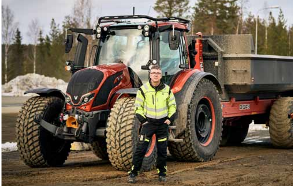
N175 är en outhärlig arbetskollega. Den förklarar arbetet varje dag.