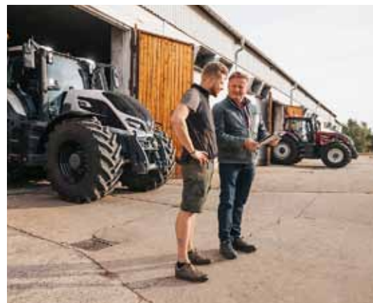
Q-seriens kunder garanteras en utmärkt service och tillgängliga reservdelar samt all teknisk support de behöver.

Syftet med alla dessa funktioner är att ägaren ska spara tid samtidigt som lönsamheten förbättras. Tack vare den smarta tekniken i precisionsjordbruket går arbets-